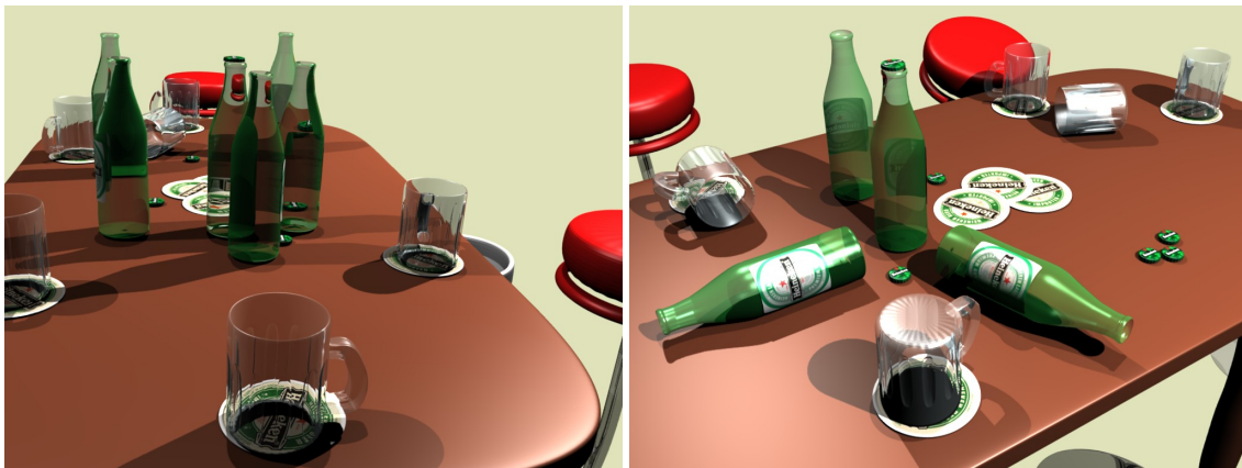
Obrázek 2: Vyrenderování výsledné scény

Obrázek 1: Modelování pивní láhve a pùllitru. Výsledný tvar pùllitru vznikl odečtením obou částí na obrázku b .