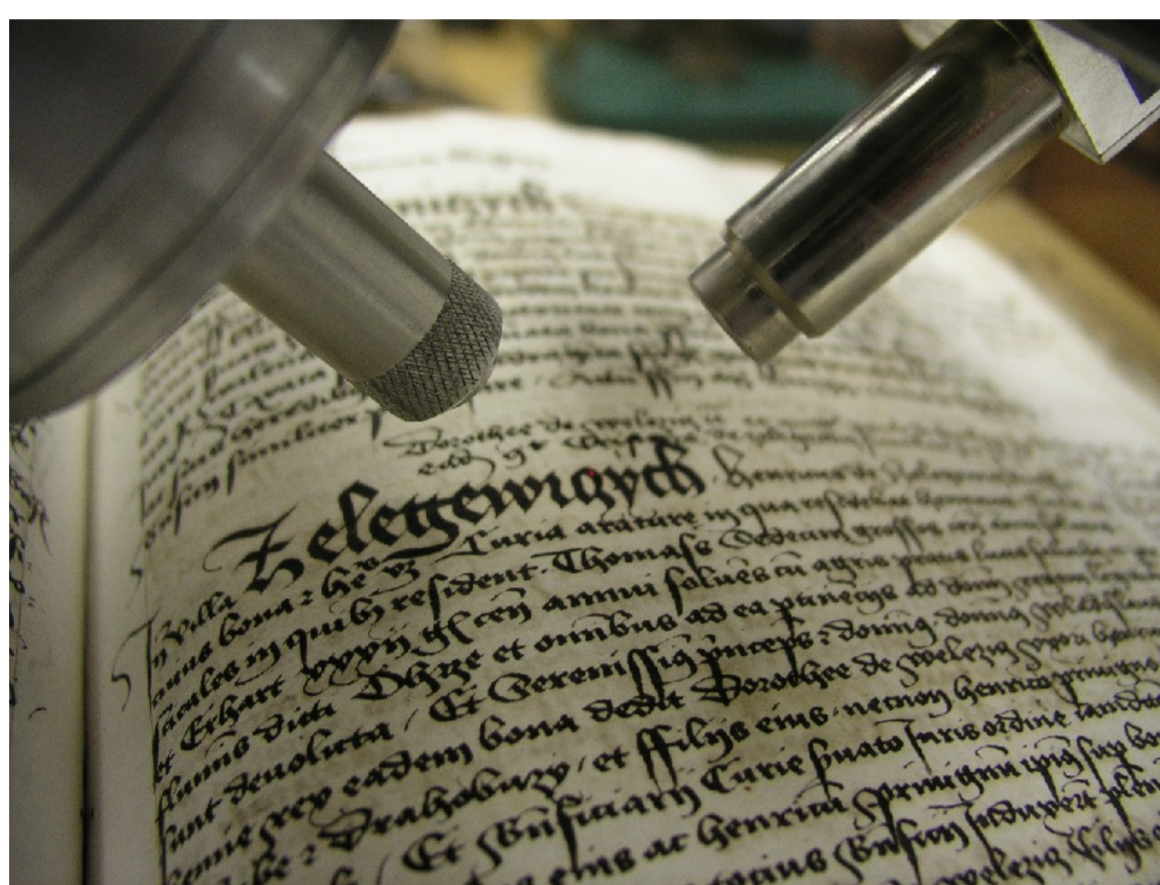
Rentgenka (vlevo) a polovodičový detektor (vpravo) při měření desek zemských ze sbírek Státního archivu v Praze

Rentgenfluorescenční analýza je fyzikální metoda, pomocí které snadno, rychle a poměrně levně určíme prvkové složení materiálu. Využívá jevu tzv. fotoefektu a je založena na buzení charakteristického záření ve vzorku primárním zářením ze zdroje. Toto vybuzené záření se detekuje v polovodičovém detektoru a získaná data lze využít k analýze materiálu.